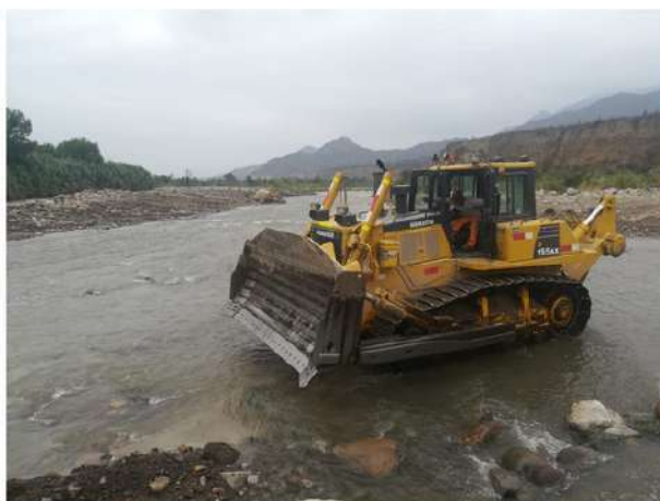
TRACTOR DE ORUGAS